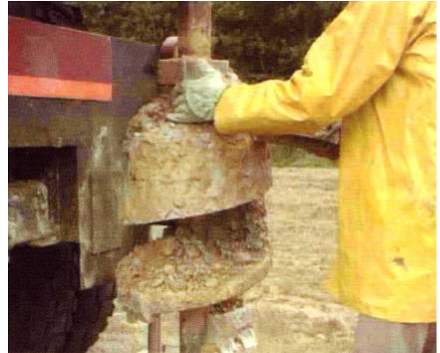
Tarière gros diamètre pour prélèvements d'échantillons pour essais de laboratoire